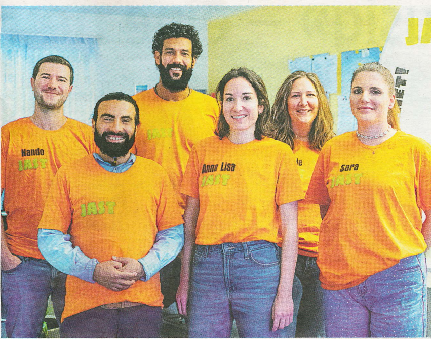
Jugendtreffbesuche JAST 2023