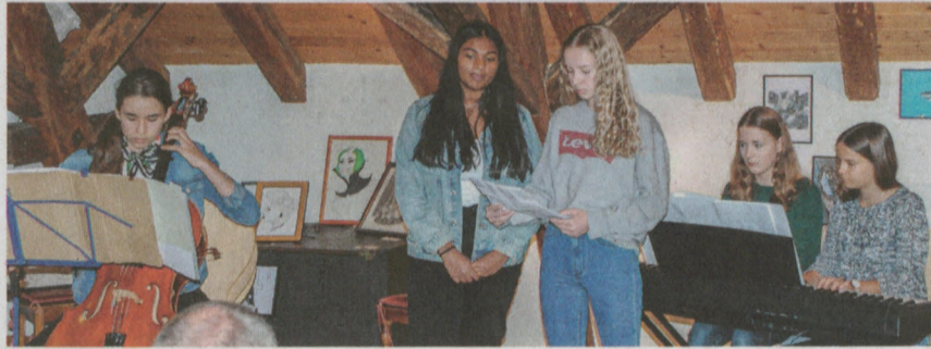
Konzert der Cool Kids