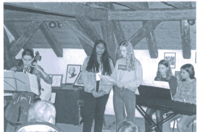
Konzert Cool Kids