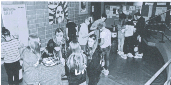
Kerzenziehen in der Schule Lengnau

Die Regionale Jugendarbeitsstelle Surbtal-Würenlingen veranstaltete vom 22. November bis 23. November 2018 wie alle zwei Jahre das Kerzenziehen im Oberstufenschulhaus Rietwiese in Lengnau. Während diesen zwei Tagen konnten alle Schülerinnen und Schüler klassenweise eine Kerze herstellen. Den Jugendlichen bereitete die Abwechslung im Schulalltag Freude, es kam eine schöne Adventsstimmung auf und es wurden spektakuläre Kerzen gezogen.