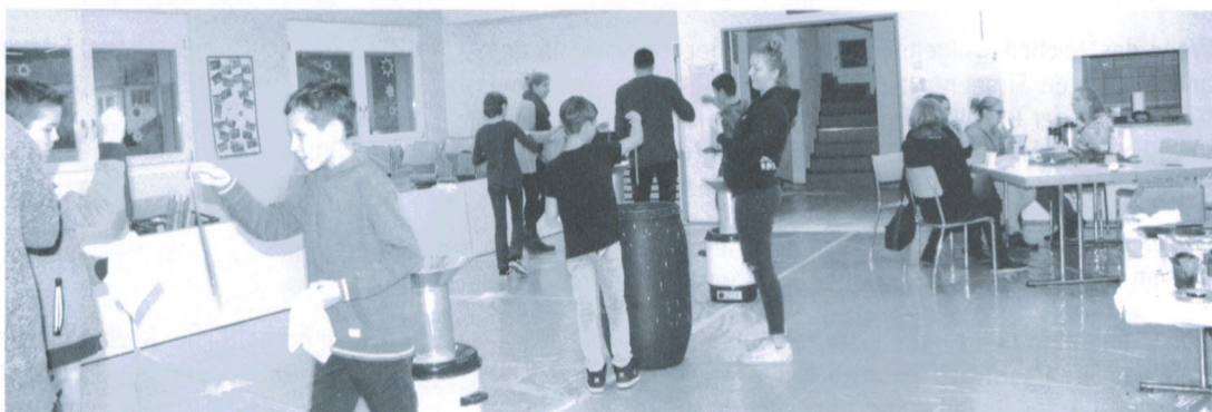
Kerzenziehen in Unterendingen